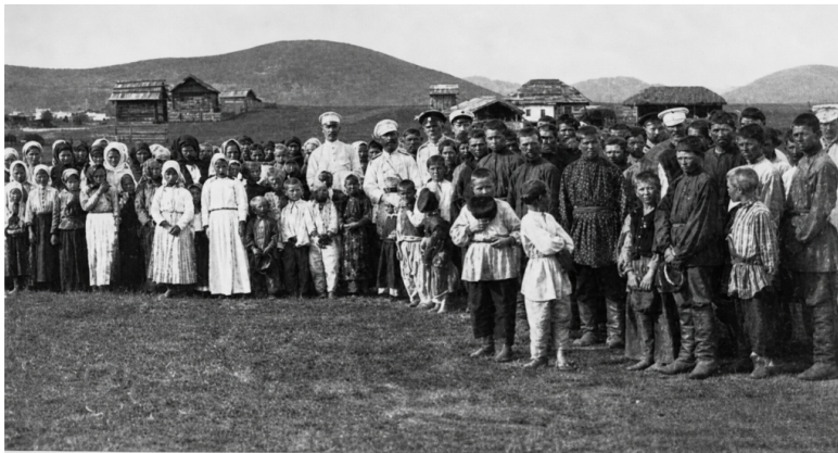
Группа переселенцев—мальороссовъ (д. Золотоноша).

Считается, что свое имя Золотоноша получила благодаря реке: ее песчаное дно, усеянное золотистой слюдой, сияло на солнце, словно настоящая золотая река. Также говорят, в середине XVII века город служил сборным пунктом налогов. Сюда стекались золотые монеты, и люди шептали: «Золотоноша — ноша золота». Другая легенда ведет к черкасским казакам, которые прятали добытое в сражениях золото в болотистых заводях реки, укрывая его от вражеских глаз. А еще рассказывают о монголо-татарской флотилии: суда, груженные данью, поглотила буря. Позже волны вынесли на берег золотые украшения, и в этом месте, как говорят старо-