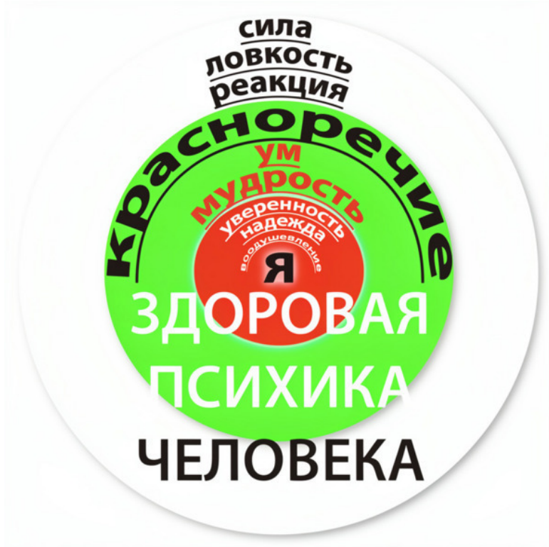
Схема 1. Модель «Здоровая Психика Человека»