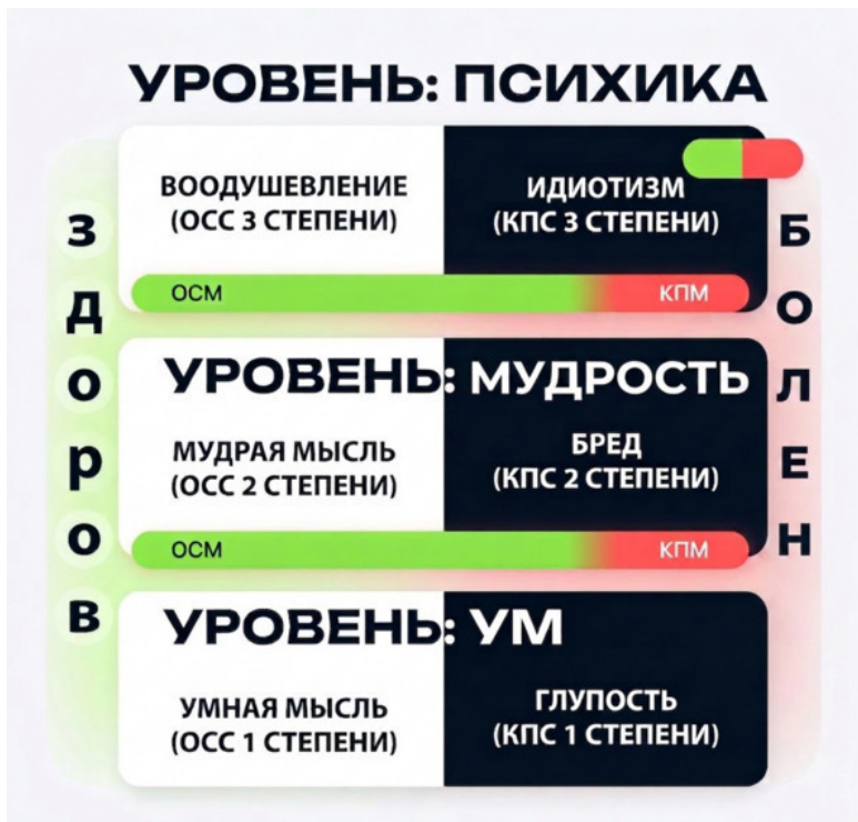
Схема 2. Соответствие Здоровой и Больной Психики