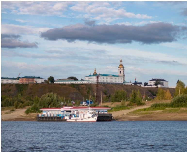
Г. Тобольск с реки Иртыш

Лодка деревянная, отцовская, рыбацкая байда (байдара) кормилица — выручай.