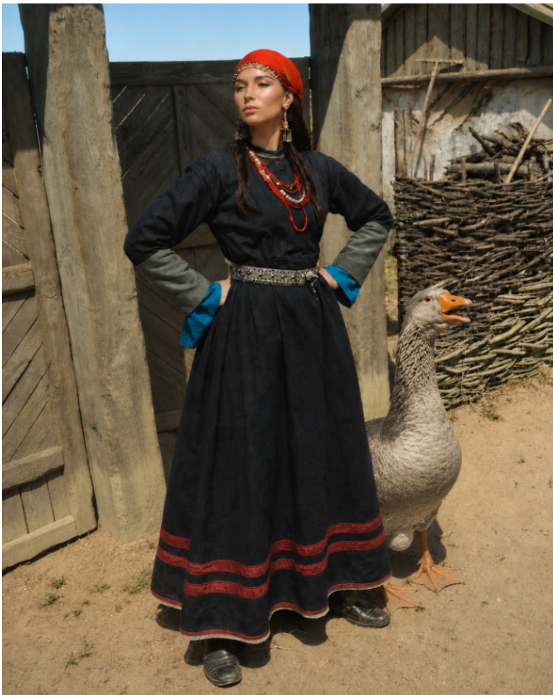
3. Заряна , нежданная любовь Ермака с гусем-телохранителем.

яицкие и уральские казаки разгромил армию Сибирского ханства и взял его столицу Искер (Сибирь). Погиб 16 августа 1585 года, на реке Иртыш при впадении в него Вагая, в дождливую ночь при неожиданном нападении татар Кучума.