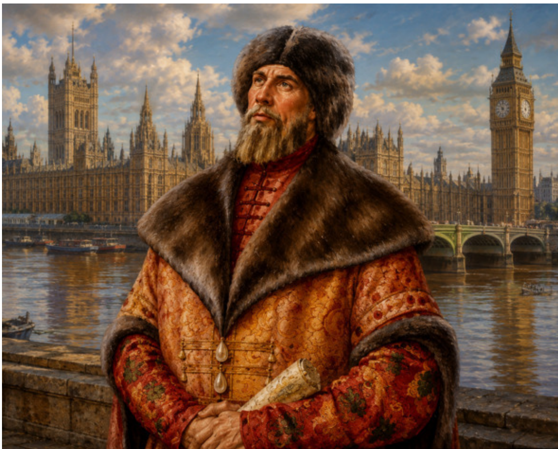
13. Первый посол России в Англии, дьяк Посольского приказа Осип Непея в меховой шубе и шапке.