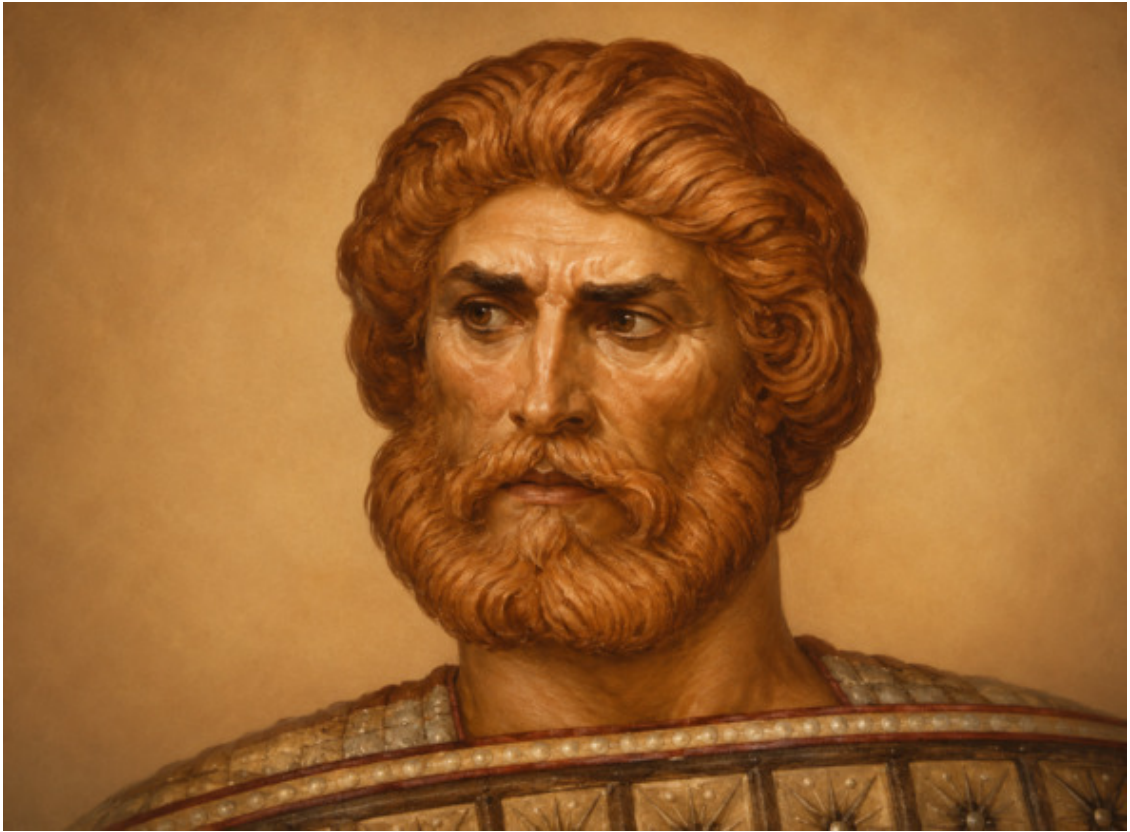
7. Атаман Никита Пан , польского происхождения, погиб при покорении Кодского княжества и взятии Назима в 1583—1584 годах.