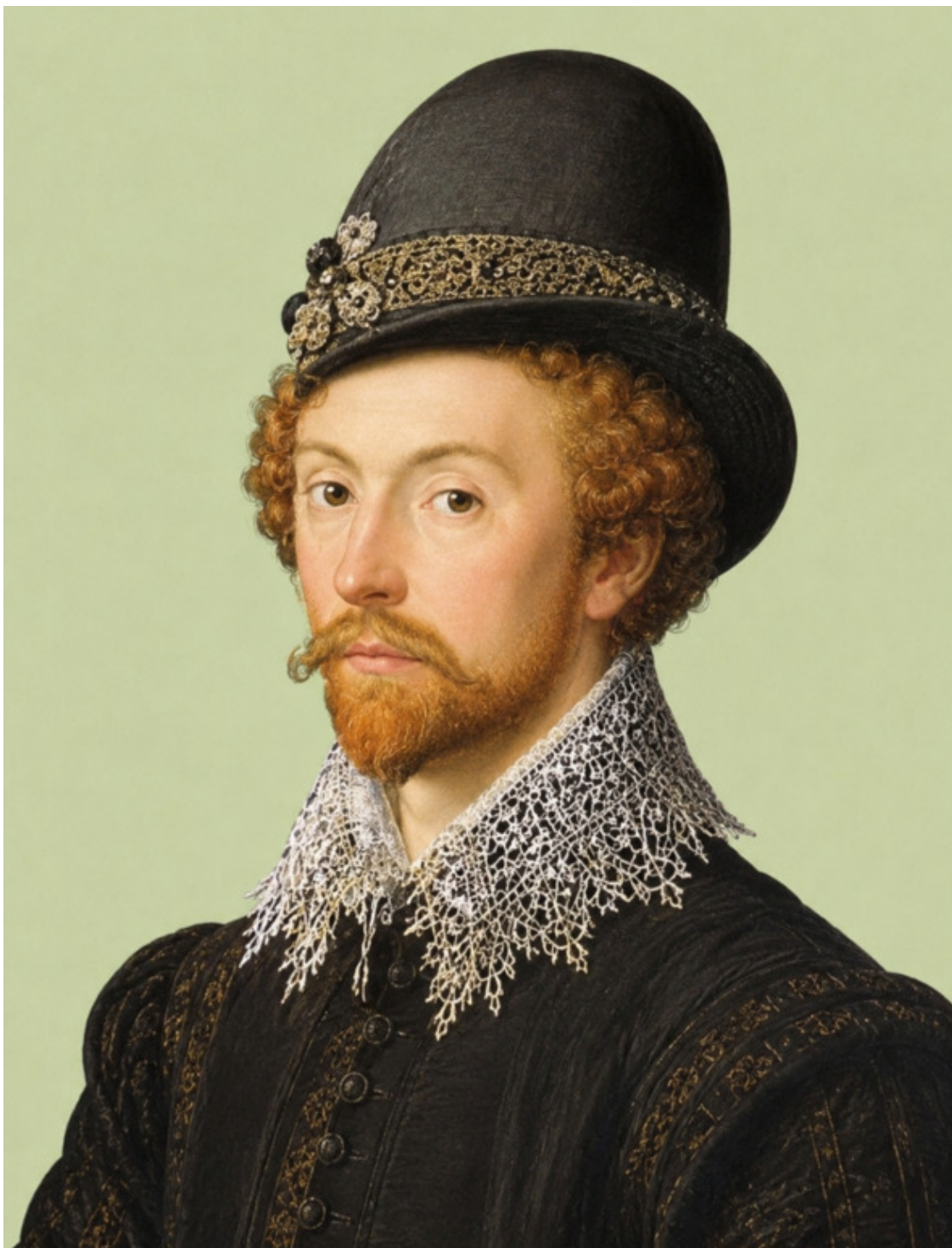
14. Энтони Джексон, английский посол в России, заморский «друг» Ивана Грозного.