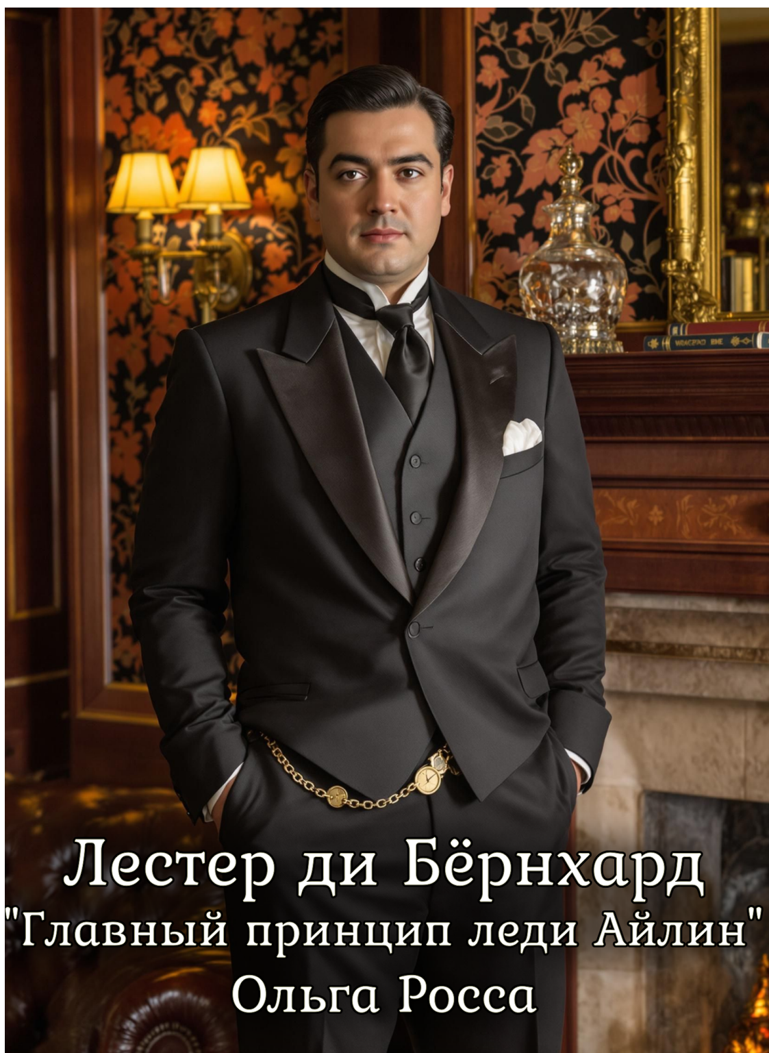
Лестер ди Бёрнхард "Главный принцип леди Айлин" Ольга Росса